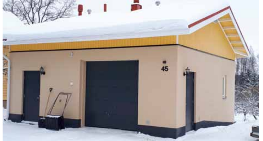
Ammattirakentaja, hyvät suunnitelmat ja valvonta.

Mediasta olemme saaneet lukea kymmenistä rakennuskohteista, joissa laatu ei täytä hyvän rakennustavan vaatimuksia. Kohteissa on todettu suuret määrät rakennusvirheitä, joista kukaan ei tahdo ottaa vastuuta. Joukossa on kerrostaloja, julkisia rakennuksia ja pientaloja.