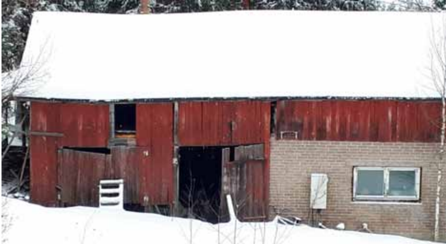
Ammattirakentaja, ei suunnitelmia, ei valvontaa.