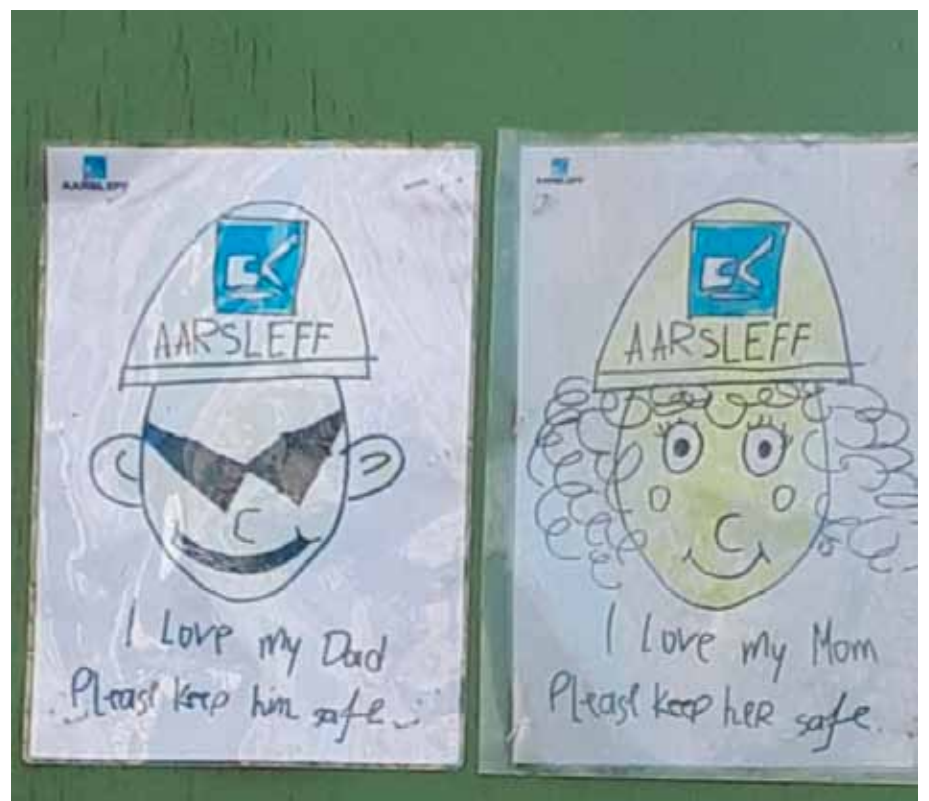
Muistutus työmaan aidassa.