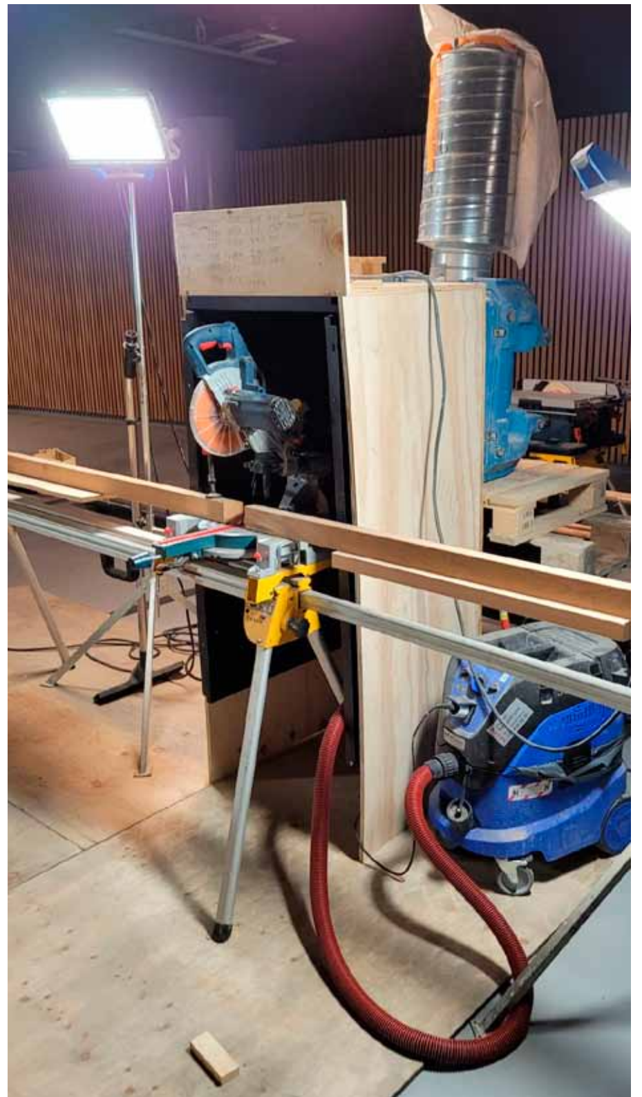
Pölynpoistoratkaisu jalopuun sahauspisteessä, hienopölyn poistoon.